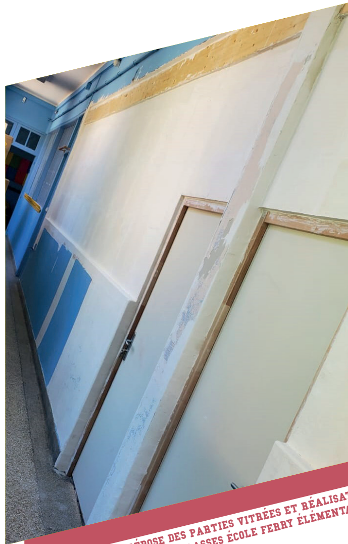
CLOISONNEMENT (DÉPOSE DES PARTIES VITRÉES ET RÉALISATION D'UN MUR D'UNE DES CLASSES ÉCOLE FERRY ÉLÉMENTAIRE)