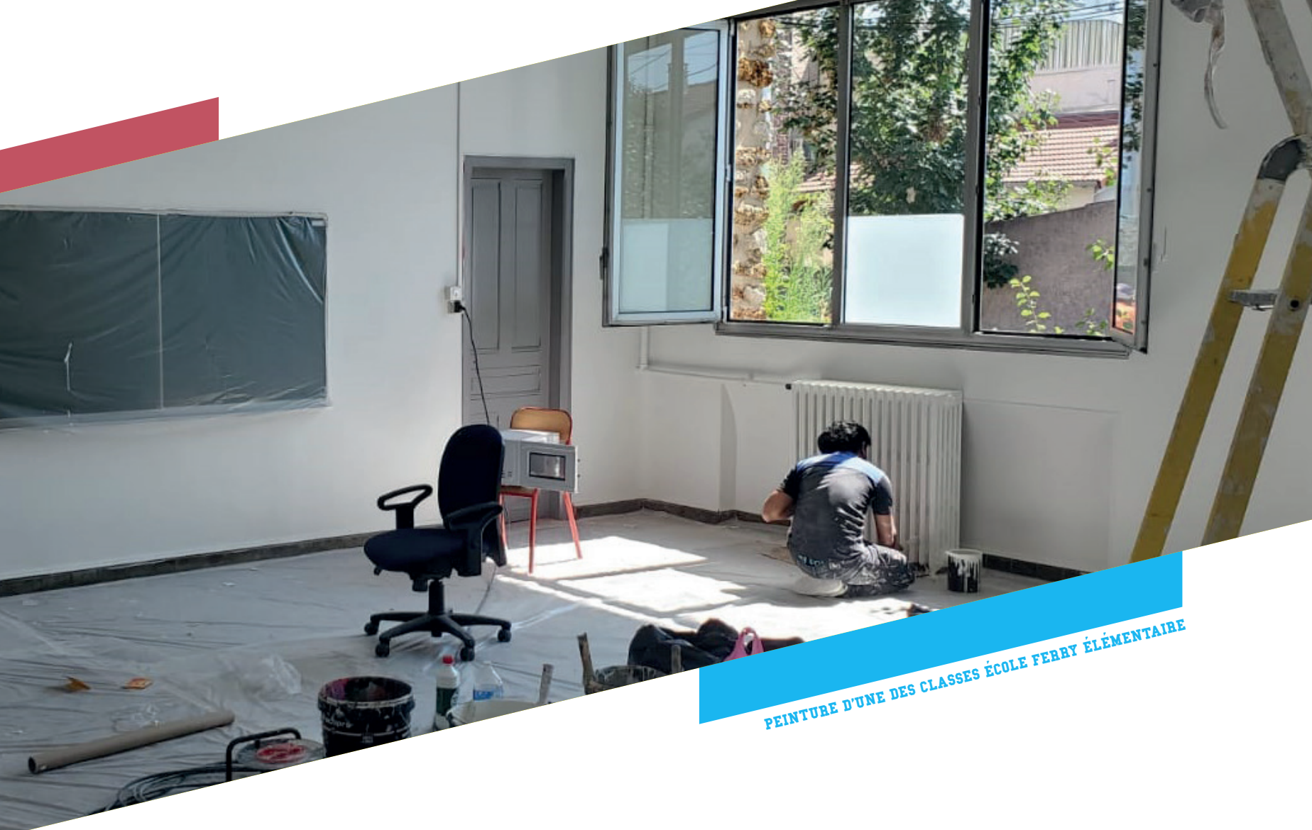
PEINTURE D'UNE DES CLASSES ÉCOLE FERRY ÉLÉMENTAIRE