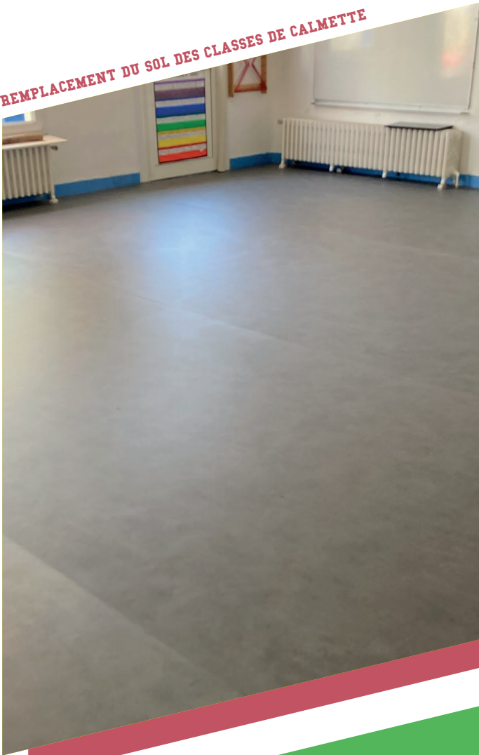
REPLACEMENT DU SOL DES CLASSES DE CALMETTE