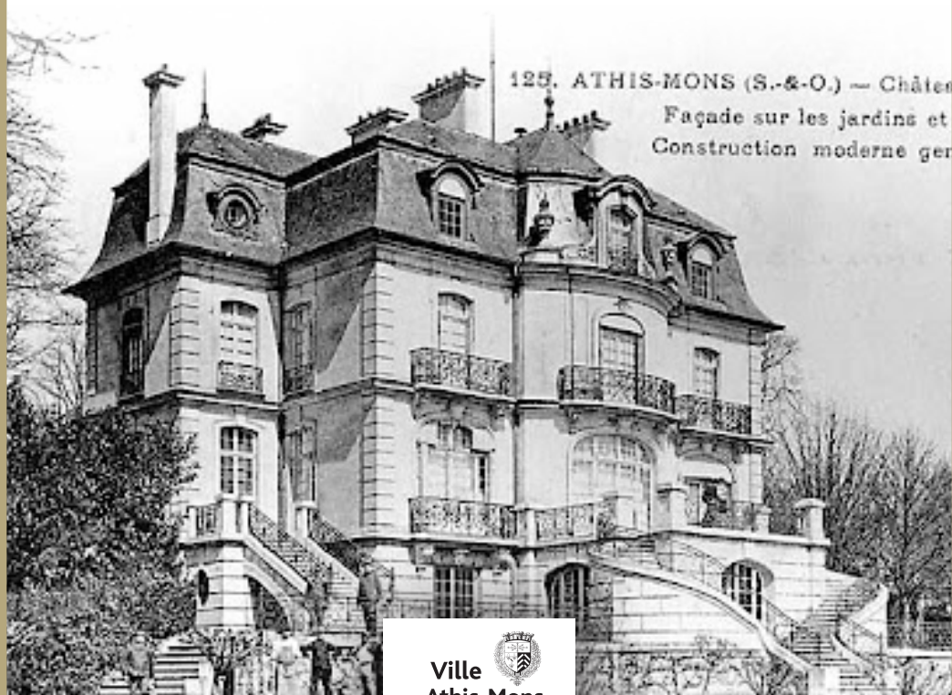
125. ATHIS-MONS (S.-&O.) — Châtes Façade sur les jardins et Construction moderne ger